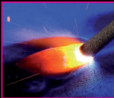
Elektro – Schweißen (Stahl)

4 mal 120 Minuten, 18:00 – 20:00 Uhr Preis: € 240,00 inkl. Materialkosten