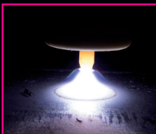
MIG/MAG – Schweißen (Stahl)

4 mal 120 Minuten, 18:00 – 20:00 Uhr Preis: € 240,00 inkl. Materialkosten