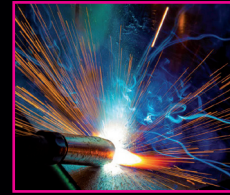
WIG – Schweißen (Stahl, Edelstahl, Alu)

Unser Motto lautet: „Wenig Theorie – viel Praxis!“